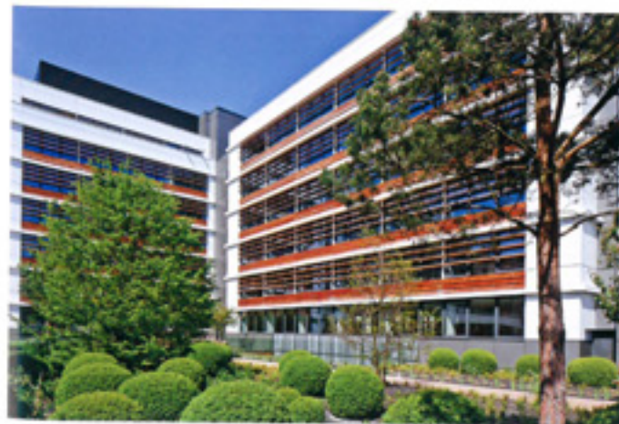
03 Jardin intérieur