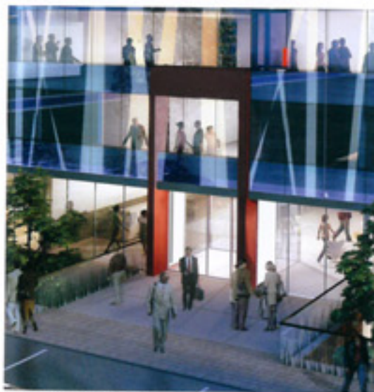
Entrée - Rue du Dôme

La façade est complètement refaite mais conserve la composition du bâtiment voisin. Le soubassement de l'immeuble est délimité par une corniche saillante en continuité de la rupture du soubassement de l'immeuble voisin. Le corps de bâtiment traité en vitrage entièrement lisse s'inscrit dans le même registre que son voisin avec une écriture contemporaine. Le retrait du dernier niveau respecte l'ordonnement de la façade voisine.