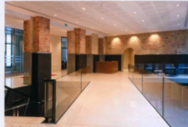
Figure emblématique du 7 e arrondissement, cette réhabilitation lourde de 5 000 m 2 a été réalisée en 2013, intégrant la création de parkings en sous œuvre. Elle a été livrée au Groupe Monceau et a été louée au Conseil Général d'Ile-de-France. L'architecte est Palissad Architecture.

Investisseur : SOCIETE CIVILE CENTRALE MONCEAU Maître d'ouvrage délégué : AXIM (voir page 68) Maître d'ouvrage : SCCM Architecte : PALISSAD ARCHITECTURE Architecte paysagiste : RAPHA Maître d'œuvre d'exécution, économiste : 2A INGENIERIE AMD environnement : GREEN AFFAIR OPC : CICAD CONSULTANTS (voir page 8) SHON : 6 200 m 2 Certification : HQE BBC Destination : Bureaux Montant des travaux : 16 500 000 € HT. Locataire : Région Ile de France Coordonnateur SPS : PRECOSS BTP Conseil sécurité, incendie, coordonnateur SSI : BATISS BET électricité : B-TELEC BET cuisine : ALMA CONSULTING BET façades : JOSEPH INGENIERIE (voir pages 30 et 276)