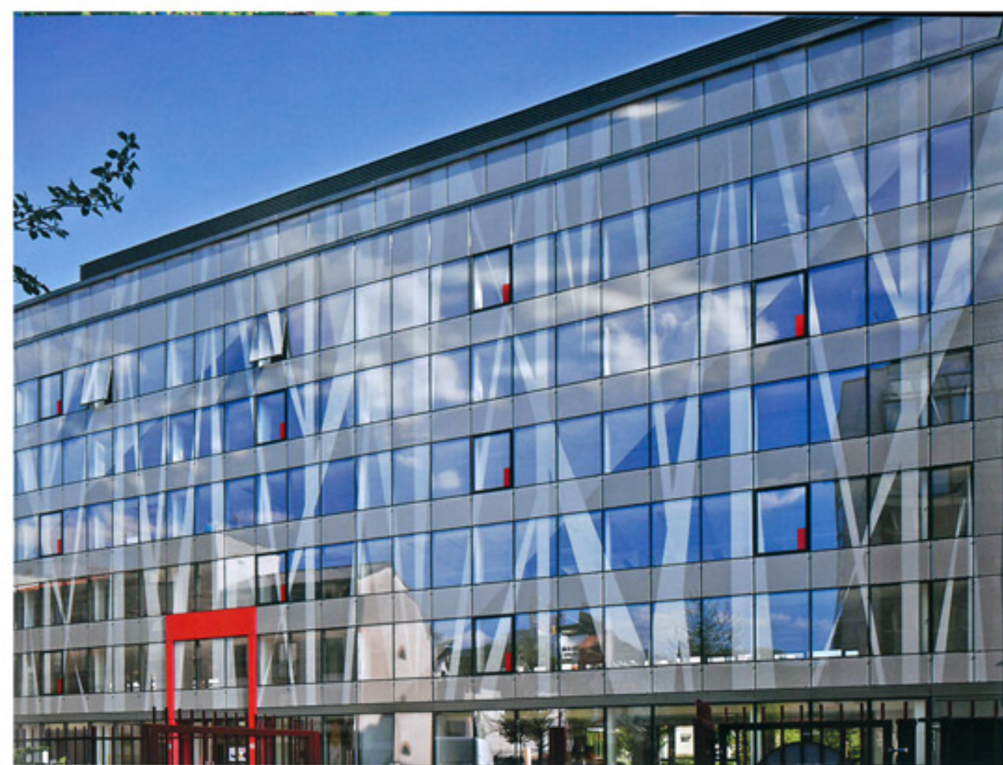
1 Façade Nord/Ouest - Rue du Dôme